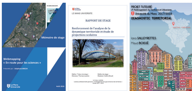
Rapports de stage, 2018.